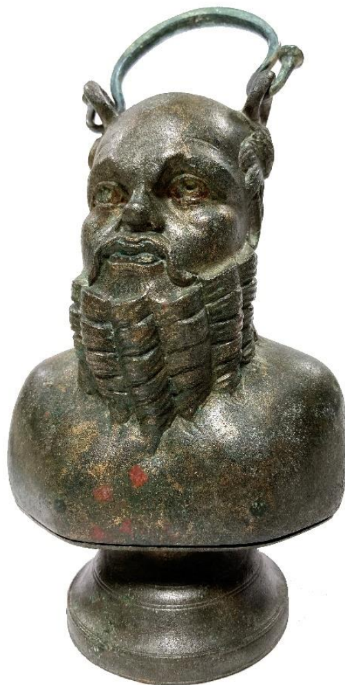
Balsamaire anthropomorphe représentant Silène (IIe-IIIe s.) Fouille Archeodunum 2022 : Briord (01) Rue Saint-Didier « les Ecolus » – RO Elio Polo

Organisées par la DRAC Auvergne-Rhône-Alpes Service Régional de l'Archéologie